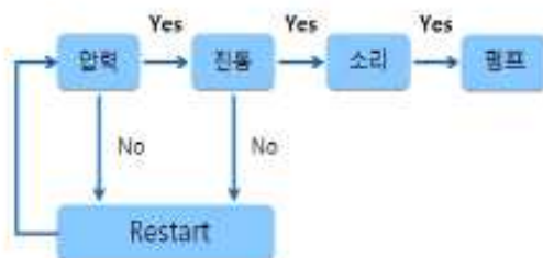
그림 1 시스템 흐름

전원을 통해 사용자가 베개에 누우면 진동 센서와 소리 센서를 차례대로 작동시킨다. 아두이노를 이용하여 코골이중 발생하는 진동과 소음이 각 센서에 입력이 되면 펌프를 작동시켜 에어백의 크기를 조절한다. 에어백 크기가 변하게 되면 사용자의 목 근육에 자극을 주어 이완된 근육을 수축, 기도를 확보하여 코골이를 멈추게 한다. 코골이가 멈추게 되면 센서에서 소리와 진동을 감지하지 못하고 펌프 작동이 중단된다.